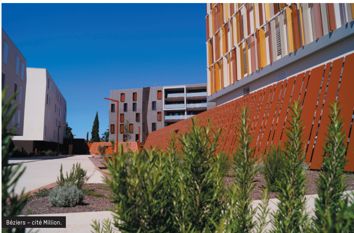
Béziers – cité Million.

Cette publication s'inscrit dans un dispositif complet de sensibilisation qui a débuté par la première Semaine des fleurs pour les abeilles , organisée par VAL'HOR du 20 au 27 juin, en partenariat avec l'Office français d'apiculture.