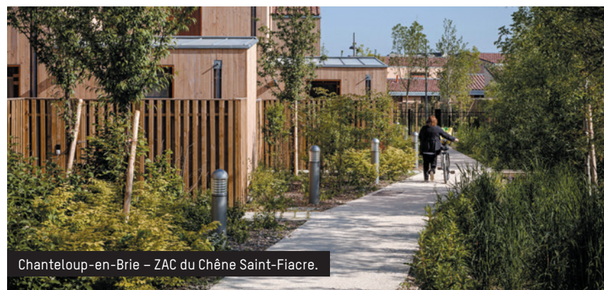
Chanteloup-en-Brie - ZAC du Chêne Saint-Fiacre.

La Résidence urbaine de France (RUF - société Immobilière 3F) a créé au cœur d'une résidence de 60 logements un continuum végétal avec une noue pour récupérer les eaux de pluie. Ce projet, élaboré avec des paysagistes, met en valeur un espace commun ouvert, planté d'arbres et sillonné de chemins piétons qui distribuent les jardins privatifs à l'arrière des logements en rez-de-chaussée. « Notre ambition ? Ordonner un programme autour de la végétation existante, notamment les très beaux arbres de plus de trois