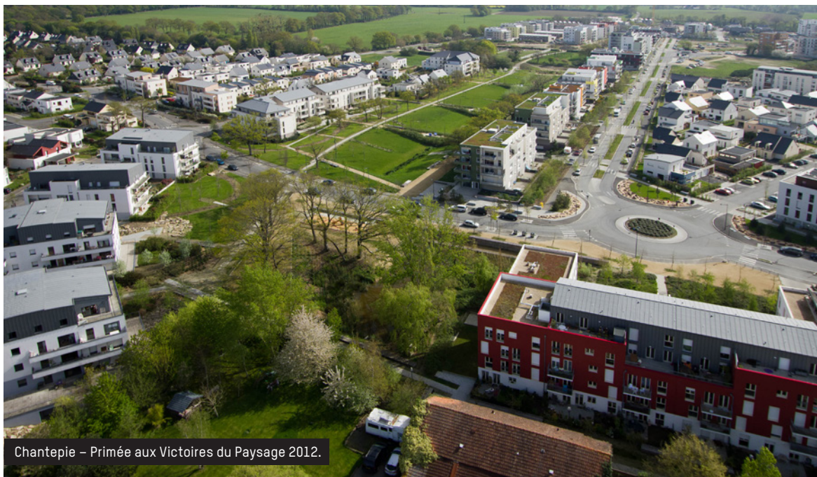
Chantepie – Primée aux Victoires du Paysage 2012.

Le paysagiste concepteur intervient sur les « vides » : les infrastructures urbaines (routes, rues, tramway...), esplanades, lieux de passage et de connexion, réseaux d'irrigation, parcs... « Or, les vides sont les éléments les plus structurants d'une ville », indique Jean-Marc Bouillon, président de la Fédération Française du Paysage. « Si cette structure primaire de la ville est mal conçue, tout ce qui sera construit dessus ne pourra pas être durable. De nombreux dysfonctionnements apparaissent dans nos villes, dus au non-respect des fondamentaux de notre écosystème. Cela concerne par exemple la gestion de l'eau de pluie, de la chaleur, de la qualité de l'air : des domaines au cœur de l'expertise du paysagiste concepteur. Ce dernier n'est donc pas le complément mais le préalable aux projets urbains. » Le paysagiste concepteur est ainsi amené à conseiller les collectivités en amont dans la définition de leur stratégie territoriale et l'élaboration de leurs documents de planification : SCOT, PLU(i), ZAC, atlas, chartes et plans de paysage, protection et mise en valeur des espaces naturels, infrastructures, stratégies paysagères à l'échelle des territoires... Il intervient par ailleurs lors de la mise en œuvre des projets, de façon à les faire bénéficier des fonctions écosystémiques de la nature.