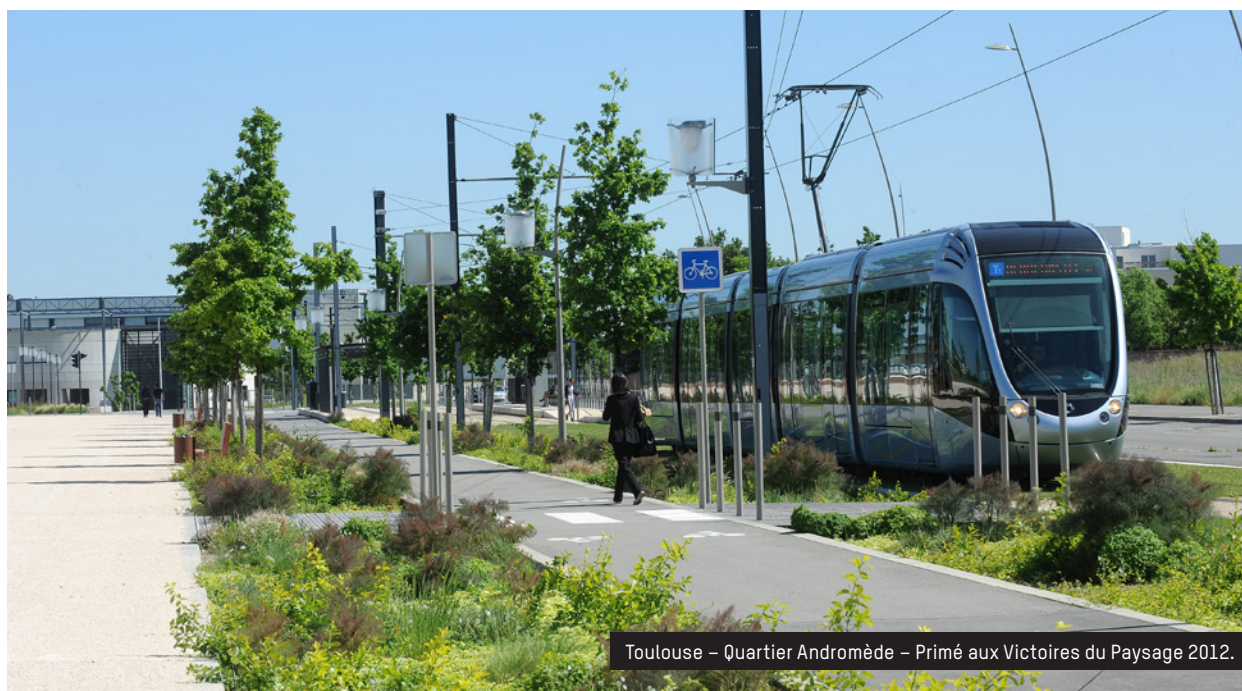
Toulouse – Quartier Andromède – Primé aux Victoires du Paysage 2012.