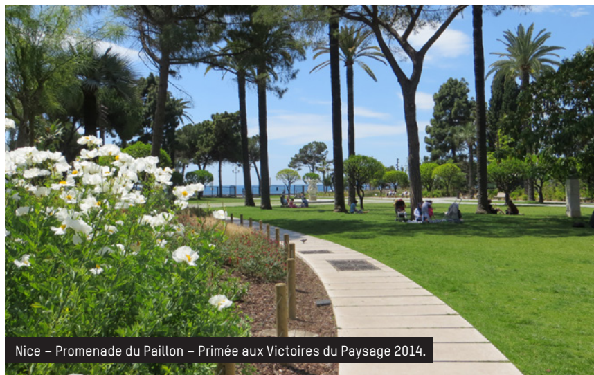
Nice – Promenade du Paillon – Primée aux Victoires du Paysage 2014.

Cette reconnaissance permet une identification claire des professionnels pour les collectivités. C'est une meilleure assurance de confier son projet au bon interlocuteur et de bénéficier d'une expertise et d'une méthodologie adaptées. Les connaissances du paysagiste concepteur apportent aussi une garantie dans les capacités de réalisation des projets et dans leur viabilité sur le long terme.