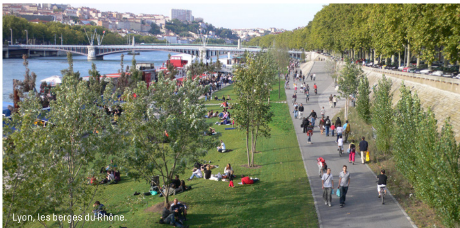
Lyon, les berges du Rhône.

Voilà plusieurs mois, une réflexion de fond menée par Val'hor dans le cadre de la démarche « Cité Verte » a donné lieu à la publication du Manifeste pour une Cité Verte et de 70 propositions pour une meilleure prise en compte des bienfaits du végétal dans la décision publique . Dans quelques jours, l'interprofession présentera aux élus locaux et aux cadres territoriaux ses propositions finales, enrichies de l'expertise des collectivités.