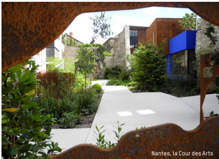
Nantes, la Cour des Arts

tous les autres critères, en particulier sociaux. Une demande des habitants désormais relayée par la volonté politique.