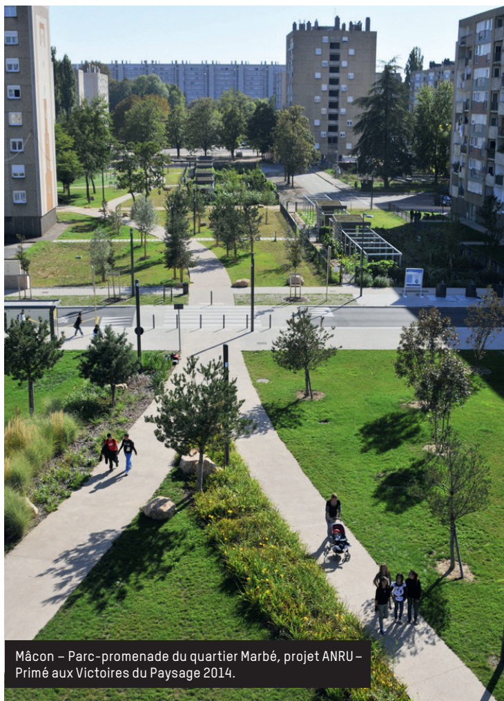
Mâcon – Parc-promenade du quartier Marbé, projet ANRU – Primé aux Victoires du Paysage 2014.

l'Énergie, pour favoriser une « économie libérée des énergies fossiles et fissiles, connectée, relocalisée et au service de l'humain » au travers de cent mesures concrètes. L'une d'entre elles, intitulée « Donner toute sa mesure au végétal », souligne l'intérêt de replacer le végétal au cœur des lieux de vie et d'intégrer la réflexion paysagère dans tout projet d'aménagement. Le rapport rappelle également la pertinence des quinze propositions prioritaires de l'interprofession pour promouvoir le végétal et le paysage au cœur de la cité. Retrouvez le rapport complet sur http://adnmonde.fr/