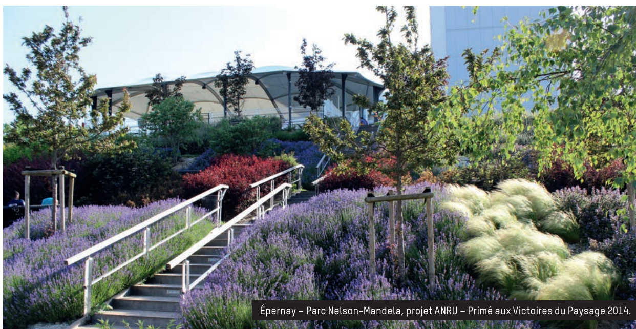
Épernay – Parc Nelson-Mandela, projet ANRU – Primé aux Victoires du Paysage 2014.

Président de la FNPHP (Fédération nationale des producteurs de l'horticulture et des pépinières)